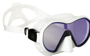
VX1 WHITE Линзы с UV покрытием