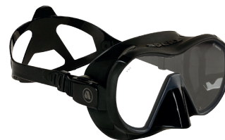
VX1 BLACK Прозрачные линзы