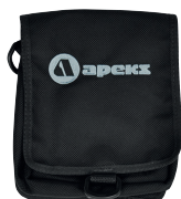
Малый карман для аксессуаров