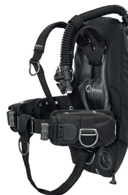
Крыло WTX D-18 со спинкой Ultralight, подвеской в виде моностропы и грузовой системой SureLock на адаптере