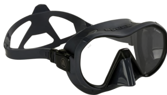
VX1 GREY Прозрачные линзы