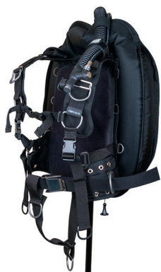
Крыло WTX D-30 с алюминиевой спинкой, подвеской в виде моностропы и грузовой системой SureLock на адаптере