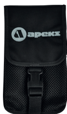
Сетчатый карман для маски