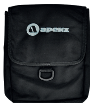
Карман на бедро

Линейка карманов для аксессуаров, которые были разработаны специально для размещения на компенсаторах плавучести WTX. Кроме того, вы можете закрепить карманы на грузовом поясе или бедре.