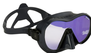
VX1 GREY Линзы с UV покрытием