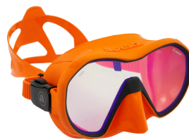
VX1 ORANGE/GREY Линзы с UV покрытием