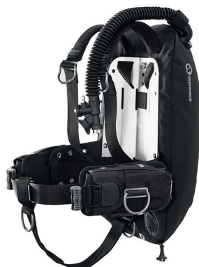
Крыло WTX D-34 со стальной спинкой и подвеской в виде моностропы, комплект ТЕК3, манифолд с изолятором, комплект баллонных колец 180 мм.