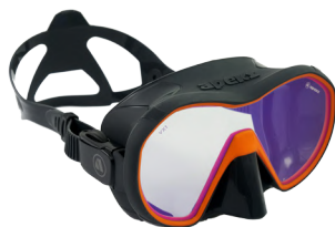
VX1 GREY/ORANGE Линзы с UV покрытием