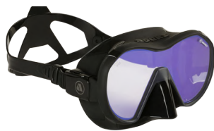
VX1 BLACK Линзы с UV покрытием