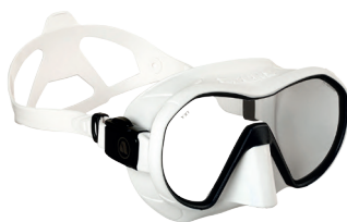
VX1 WHITE Прозрачные линзы