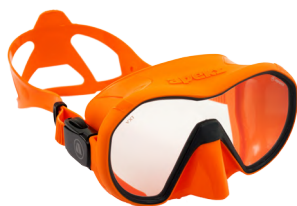
VX1 ORANGE/GREY Прозрачные линзы