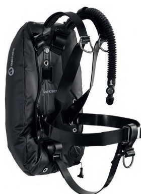
Крыло WTX 3 с мягкой подвесной системой WTX