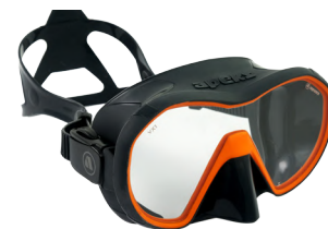
VX1 ORANGE/GREY Прозрачные линзы