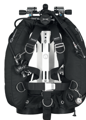
Крыло WTX D-30 PSD со спинкой Ultralight и подвеской в виде моностропы