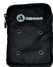
Большой карман для аксессуаров