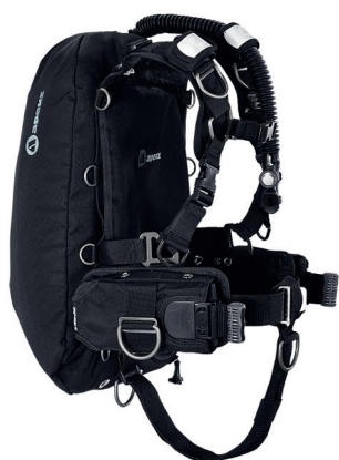
Крыло WTX D-40 с мягкой подвеской WTX и грузовой системой SureLock